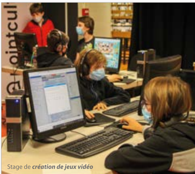
Stage de création de jeux vidéo

pour expliquer ses démarches artistiques et en partager les fruits avec le grand public.