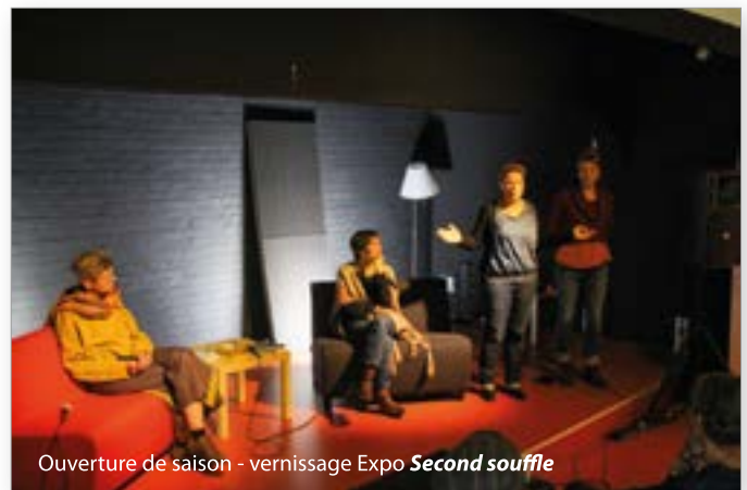
Ouverture de saison - vernissage Expo Second souffle

partenaires locaux ont dû être annulés ou reportés en raison des contraintes liées à la pandémie. Cela a concerné entre autres la Nuit du Jeu (à laquelle nous devons participer en collaboration avec la Ludothèque d'Ottignies-Louvain-la-Neuve) et les ateliers Antémonde . Mais ce n'est que partie remise.