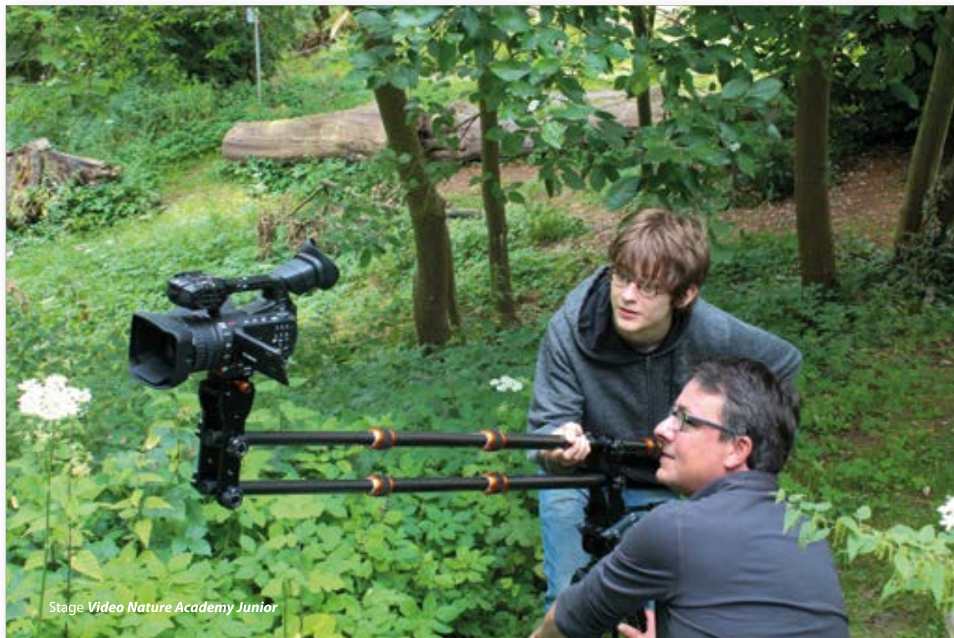
Stage Video Nature Academy Junior

Un premier noyau d'opérateurs a été constitué, ce dernier comprend actuellement le groupe porteur du collectif pour la mise en place du PECA dans le bassin de Namur. Ces opérateurs ont une action territoriale (au moins à l'échelle d'un arrondissement) et/ou un regard interdisciplinaire (abordant