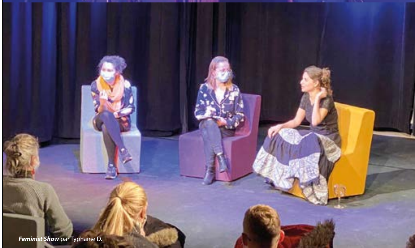
Feminist Show par Typhaine D.