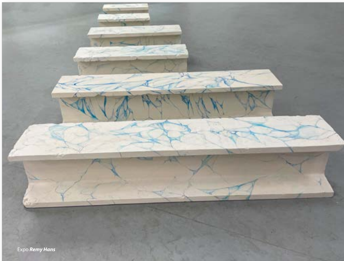
Expo Remy Hans

Le but était, a minima, de ne pas laisser le public indifférent ou, mieux encore, de le faire réagir. De plus, face à la pandémie, ces slogans ont été pensés en écho de l'actualité, générant un double sens.