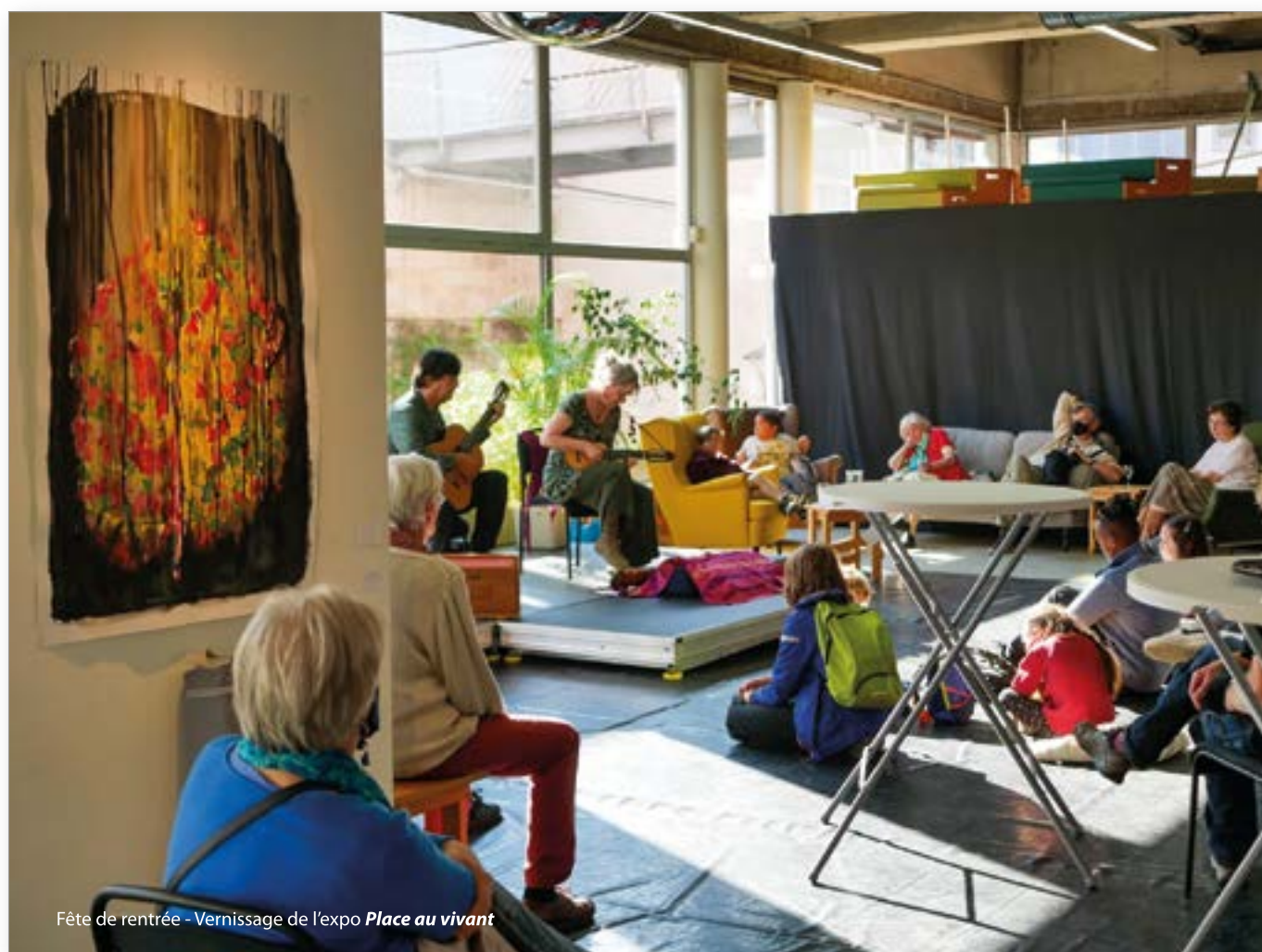
Fête de rentrée - Vernissage de l'expo Place au vivant