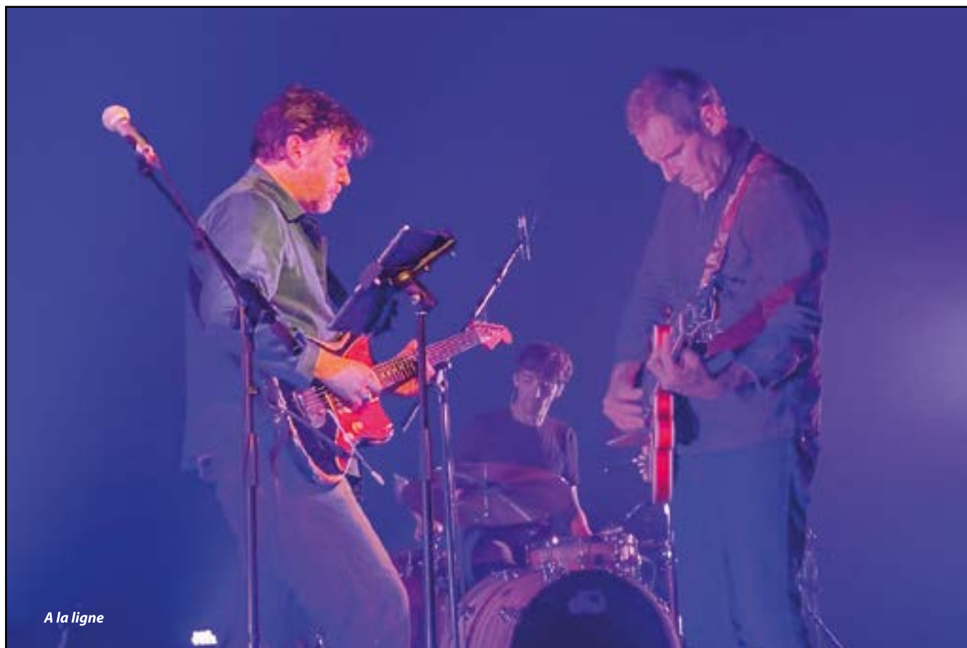
A la ligne