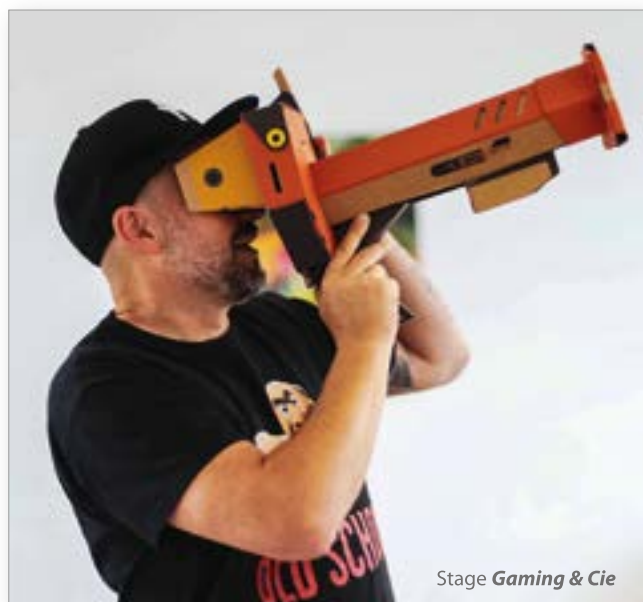
Stage Gaming & Cie

Ce qui prouve que le travail effectué par notre Service éducatif depuis de longues années, ainsi que la vie du réseau à un rôle très important qui va bien au-delà du monde scolaire et du monde culturel.